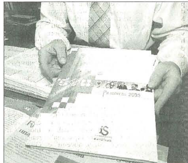
Le cartelle dei palinsesti Mediaset si fanno a Cavaria

Azienda aderente all'Associazione Artigiani della provincia di Varese.