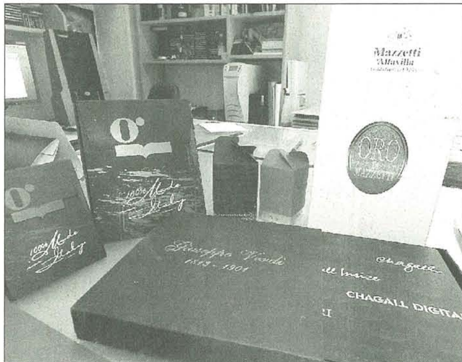
Alcune delle realizzazioni di Grafica Valdarno

LA termografia è una tecnica di stampa tridimensionale che coinvolge la vista ma anche il tatto portando in rilievo una parte dell'immagine o tutto il suo insieme. Quando l'inchiostro è ancora umido la superficie interessata al trattamento viene coperta da uno strato uniforme di polvere termografica. LA polvere in eccesso viene asportata, un nastro trasportatore inserisce il foglio all'interno di un forno a pannelli radianti che polimerizza la polvere fusa sui grafismi; in uscita c'è una sezione Uv opzionale e il raffreddamento ad aria con la doppia azione dall'alto dal basso che consente di ridurre la temperatura del foglio. Mescolando poi alla polvere altre polveri particolari si ottengono effetti tattili e visivi di grande impatto.